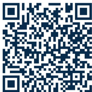
"ТРАДИЦИИ И ОБЫЧАИ НАРОДОВ ПОВОЛЖЬЯ"