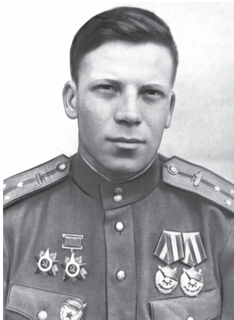
Июль 1945 г. Германия