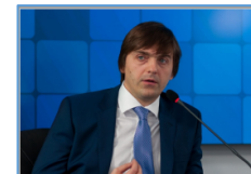
С.С. Кравцов – министр просвещения РФ

Участие обучающихся в конкурсе «Большая перемена»