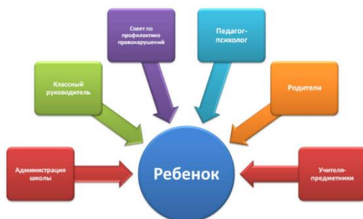
Основные рекомендации педагога родителям

Методические рекомендации классному руководителю по организации профилактической работы